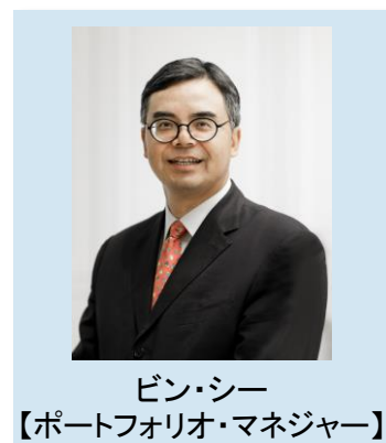
ビン・シー 【ポートフォリオ・マネジャー】