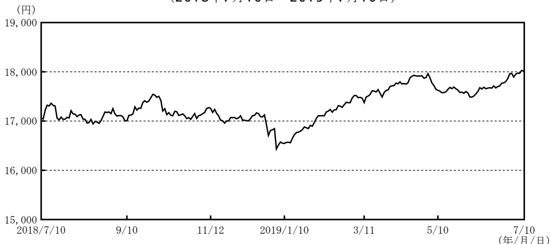
＜当期の基準価額の推移＞ (2018年7月10日～2019年7月10日)

■基準価額は期首比で951円値上がりしました。なお、基準価額の騰落率は+5.6%となりました。