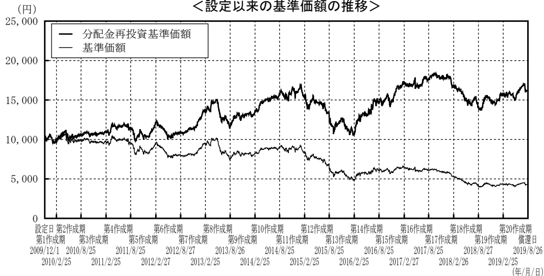
＜設定以来の基準価額の推移＞

※分配金再投資基準価額は、設定日の値を基準価額と同一となるように指数化しています。