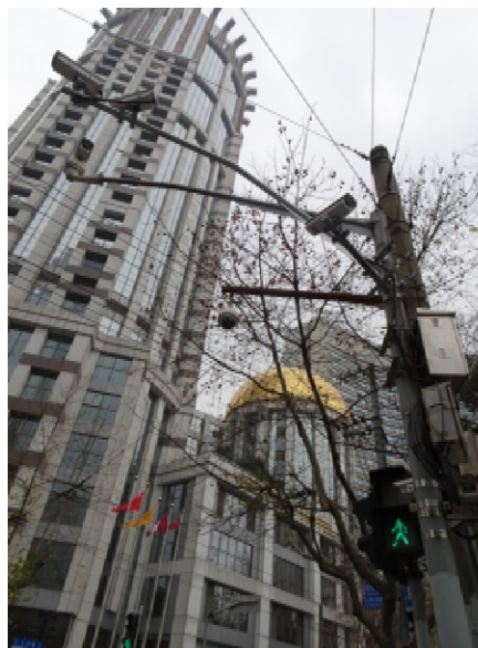
上海市内の交差点

中国では LINE が使えなくなったのが最も不便であった。グーグルやフェースブック、ツイッターが使えないと聞いていたが、LINE も 2014 年 7 月から規制されていた。中国のネット規制システムは『金盾』（キンジュン）と呼ばれている。この金盾によるアクセス規制は、中国の微博（ウェイボー）や微信（ウィーチャット）の独占状態を作り、彼らの大躍進の要因になっている。この展開は、中国政府と中国企業にとっては作戦通りなのだろう。