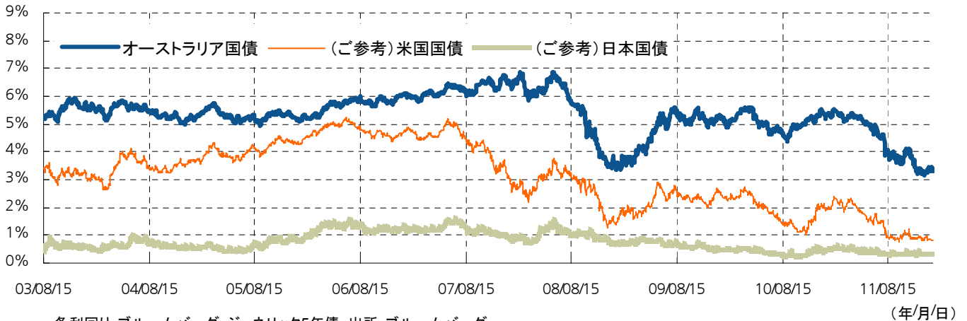
国債利回りの推移(ファンド設定日(2003年8月15日)~2012年1月17日)